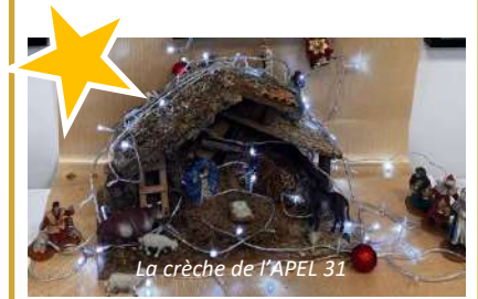
La crèche de l'APEL 31

Les dossiers CONCOURS DE CRÈCHE sont à déposer avant le 15 janvier. Thème : « sur les pas de Saint Joseph »