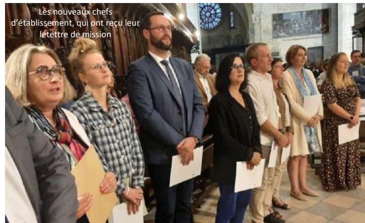
Les nouveaux chefs d'établissement, qui ont reçu leur lettre de mission