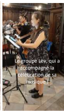
Le groupe LèV, qui a accompagné la célébration de sa musique !