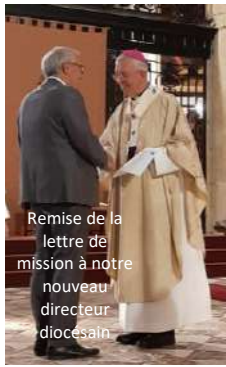
Remise de la lettre de mission à notre nouveau directeur diocésain