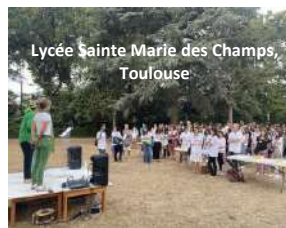
Lycée Sainte Marie des Champs, Toulouse