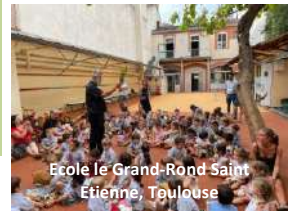
Ecole Le Grand-Rond Saint Etienne, Toulouse