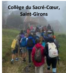
Collège du Sacré-Cœur, Saint-Girons

(Etablissement St François La Cadène, Labège)