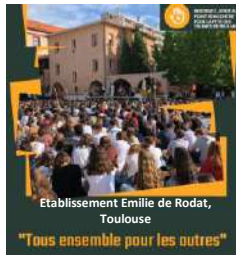
Etablissement Emilie de Rodat, Toulouse

(Ensemble scolaire Ste Geneviève, Saint Jory)