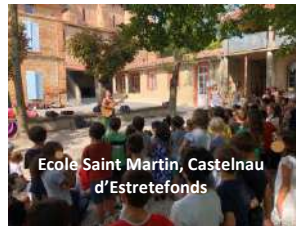
Ecole Saint Martin, Castelnau d'Estretfonds