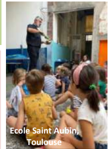
Ecole Saint Aubin, Toulouse