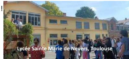
Lycée Sainte Marie de Nevers, Toulouse

(Ensemble scolaire Ste Thérèse, Saint-Gaudens)